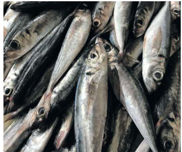
FOTO / PIXABAY FISKE. / Under mandatperioden arbetar Europaparlamentet med att implementera den nya gemensamma fiskeripolitiken (CFP). Målet är att skapa ett långsiktigt hållbart fiskeri i alla EU:s vatten, det tjänar både yrkesfiskarna och miljön på i längden. Torvalds har ansvarat för det kanske viktigaste lagförslaget under mandatperioden, nämligen förordningen som justerar bl.a. vilka redskap som ska få användas i fiskeriet runt om i EU. Utöver det har Torvalds också följt med förhandlingarna kring Östersjöns fiskekvoter.

FOTO / PIXABAY AVFALLSDIREKTIVET. / För Torvalds del fortsatte arbetet med revideringen av EU:s avfallsdirektiv, där Torvalds fungerar som ALDE-gruppens ansvarsförhandlare. Arbetet med avfallsdirektiven gick under verksamhetsåret in i så kallade dialogförhandlingar, det vill säga trepartsförhandlingar mellan Europaparlamentet, Europeiska kommissionen och Europeiska unionens råd. Torvalds hade lyckats samla en bred majoritet för sina ändringsförslag och Europaparlamentets förhandlingsposition antogs även den med bred marginal. Europaparlamentet gick tack vare detta in i dialogerna som en stark förhandlingspart, och lyckades säkra ett gott resultat i många nyckelfrågor. Ambitionsnivån för de procentuella målsättningarna för återvinnings- och återanvändningsgraderna sänktes märkbart, vilket inte motsvarade parlamentets position, men i övrigt lyckades förhandlingarna nå enighet om förbättrade och tydligare regler för avfallshanteringen i EU. Detta kommer i det långa loppet förhoppningsvis att leda till bland annat minskande mängder avfall på soptippar och ökade mängder återvinning och återanvändning, både av primära och sekundära råmaterial. Arbetet med avfallsdirektiven kommer officiellt att avslutas i april 2018 då de reviderade förslagen kommer till omröstning och godkännande i Europaparlamentets plenarsession.