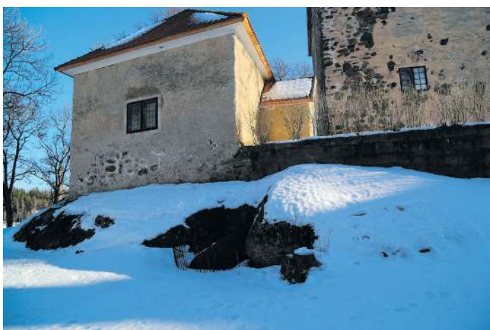
JÄTTEGRYTA NEDANFÖR KAPELLET.

METAN ÄR INGEN jättelik investering. Många andra miljövänliga drivmedelslösningar kräver en infrastruktur som blir dyr när den också ska byggas ut i glesbygden. Ganska upprymd över de möjligheter Qvidja Kraft kan öppna, styr jag bort mot bron över Björnsundet. En del av en miljö från min tidigaste barndom håller på att förändras. Tillförsikten blandas alltså också här med en liten gnutt saknad över det som en gång fanns.