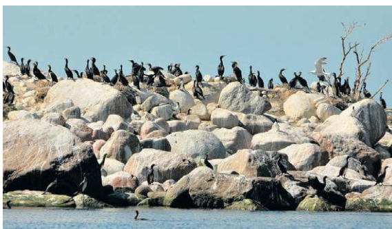
SKARVEN. / Skarvfrågan i Finland väntar ännu på sin lösning. Att få till stånd en åtgärdsplan för decimering av skarvstammen på kort och lång sikt tycks sitta hårt åt och inom kort är skarvarna här igen. Mardrömmen tycks aldrig ta slut för yrkesfiskare, skärgårdsfolk och villabor. Torvalds har jobbat aktivt med frågan genom att ställa frågor till kommissionen och krävt att de finländska myndigheterna skrider till åtgärder.

Vid sidan av de direkta negativa effekterna, skapar också möjligheten till skatteflykt en ojämlik spelplan för företagen, något som i förlängningen får mycket negativa konsekvenser för real ekonomin. Under året har specialutskottet, i vilket Torvalds är en aktiv suppleant, sammanställt sin rapport bestående av två delar: en analys av vilka lärdomar vi kan dra av Panamaläckan samt innehållande rekommendationer för vilka åtgärder som kan tas på EU-nivå för att förhindra att det här ska kunna upprepas i framtiden.