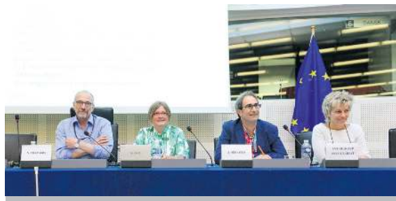
MINORITETER. / I Europaparlamentet arbetar minoritetsintergruppen, ledd av Nils Torvalds, med att lyfta upp situationer för språkliga och regionala minoriteter i EU, samtidigt som lagstiftningen granskas med minoritetsglasögon. Under året samlade det europeiska medborgarinitiativet för ett utökat minoritetsskydd inom EU en miljon underskrifter och kommer därför att behandlas av parlamentet.

VARGEN. / Under föregående år uppdagades det ett allt mer utspritt problem med vargar som söker sig till tätt bebodda områden. Att ha rovdjur strykande kring hemknutarna skapar bara onödigt stress och rädsla, samt i vissa fall ekonomisk skada ifall djuret ger sig på boskapsdjur. Att det inte idkas skydds jakt beror på en strikt tolkning av EU:s artdirektiv av myndigheterna. Under året har Torvalds krävt svar av dem, samt av EU-kommissionen, för att hitta en lösning på detta problem.