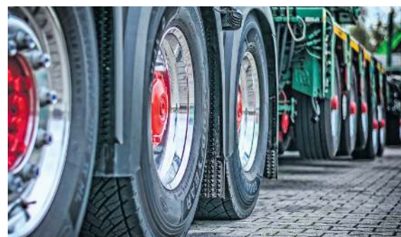
LASTBILSUTSLÄPP. / Under året arbetade Torvalds även med lagstiftningsförslaget för övervakning och rapportering av koldioxidutsläpp från lastbilar, där han fungerade som ALDE-gruppens ansvarsförhandlare. Lagstiftningen är historisk, i.o.m. att det är den första inom EU som berör lastbilar. Arbetet med lagstiftningsförslaget slutfördes i slutet på mars 2018 och lägger grund för kommande lagstiftning om koldioxidutsläppsminskningar från lastbilar.

BREXIT. / EU-parlamentet måste godkänna utträdesavtalet med Storbritannien. Den liberale belgiske EU-parlamentarikern Guy Verhofstadt har utsetts till parlamentets representant i förhandlingarna. I april 2017 röstade EU-parlamentet fram sina utgångspunkter. Parlamentet anför principen att ett EU-medlemskap på alla områden måste vara bättre än att inte vara med. Den 3 oktober 2017 röstade EU-parlamentet för en resolution som sade att framstegen i förhandlingarna inte var tillräckliga för att gå vidare och diskutera exempelvis ett framtida handelsavtal mellan EU och Storbritannien. Under våren har förhandlingarna fortsatt.