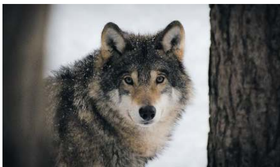
VARGEN. / Under föregående år uppdagades det ett allt mer utspritt problem med vargar som söker sig till tätt bebodda områden. Att ha rovdjur strykande kring hemknutarna skapar bara onödigt stress och rädsla, samt i vissa fall ekonomisk skada ifall djuret ger sig på boskapsdjur. Att det inte idkas skydds jakt beror på en strikt tolkning av EU:s artdirektiv av myndigheterna. Under året har Torvalds krävt svar av dem, samt av EU-kommissionen, för att hitta en lösning på detta problem.

SKARVEN. / Skarvfrågan i Finland väntar ännu på sin lösning. Att få till stånd en åtgärdsplan för decimering av skarvstammen på kort och lång sikt tycks sitta hårt åt och inom kort är skarvarna här igen. Mardrömmen tycks aldrig ta slut för yrkesfiskare, skärgårdsfolk och villabor. Torvalds har jobbat aktivt med frågan genom att ställa frågor till kommissionen och krävt att de finländska myndigheterna skrider till åtgärder.