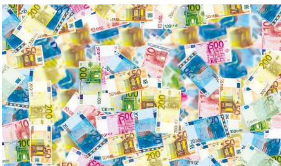
FOTO / PIXABAY SKATTEFUSK. / Efter skandalen kring de så kallade "Panama-pappren" inrättade Europaparlamentet ett specialutskott för att utreda vilka lärdomar man kan dra från läckan samt identifiera vilka åtgärder man kan fatta på EU-nivå för att komma åt problemen.

FOTO / PIXABAY LULUCF. / Den kryptiska akronymen hänvisar till markanvändning, förändrad markanvändning och skogsbruk (Land Use, Land Use Change and Forestry), ett förslag från EU-kommissionen om hur utsläpp och upptagande av växthusgaser från nämnda sektorer ska inbegripas i EU:s klimat- och energipolitik fram till 2030. Arbetet med lagförslaget, där Nils Torvalds var ALDE:s ansvariga förhandlare, avslutades i april 2018. Stora skillnader mellan EU:s medlemsländer i fråga om kolsänkors storlek och markanvändningskategoriernas betydelse, och beräkningen av dessa inom ramen av klimat- och energipolitiken, medförde att förhandlingarna blev mycket svåra och långa, men att Finlands sätt att göra ett hållbart skogsbruk godkändes, genom Torvalds' gedigna arbete i parlamentet.